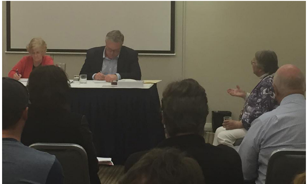
La “Investigación popular” de Australia: un padre aporta pruebas al panel de investigación sobre el impacto de la privatización de los servicios del cuidado de las personas ancianas, discapacitadas y de la atención domiciliaria en las viviendas sociales y los hogares colectivos.