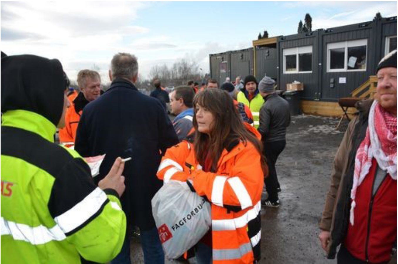
Los representantes sindicales locales de Fagforbundet se acercan a los trabajadores de Vereino para afiliarlos en el sindicato antes de la inminente remunicipalización de los servicios de recogida de residuos de Oslo.